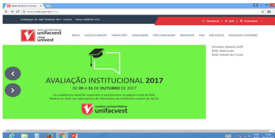
Figura 1 – Banner no Site

A divulgação também foi realizada nas Semanas Acadêmicas, nas reuniões de NDE's, e ainda foi disponibilizado os laboratórios de computação para os acadêmicos participarem, com cronograma definindo horários e turmas. Para todos os discentes ou docentes que não poderiam fazer fora da IES, foi disponibilizado um cronograma (conforme figura 2) elaborado por turma, sendo enviado para as coordenações, docentes e fixado os cronogramas nos laboratórios e salas de aula.